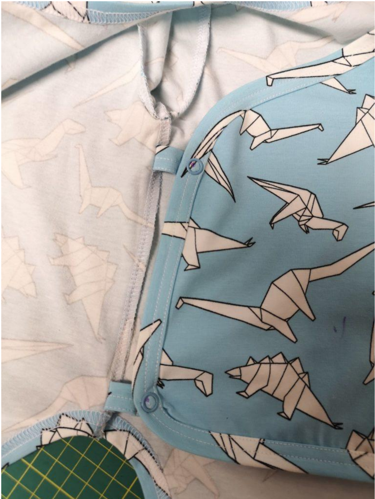
29. A druhou část patentků na levý PD