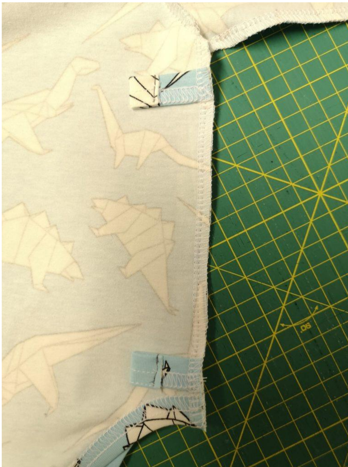
15. Detail sešití.