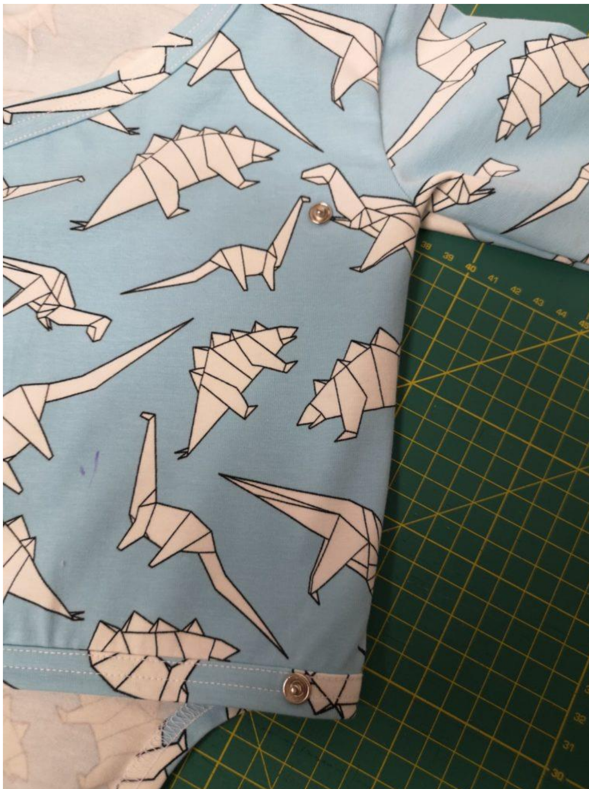
27. Připevněné patentky