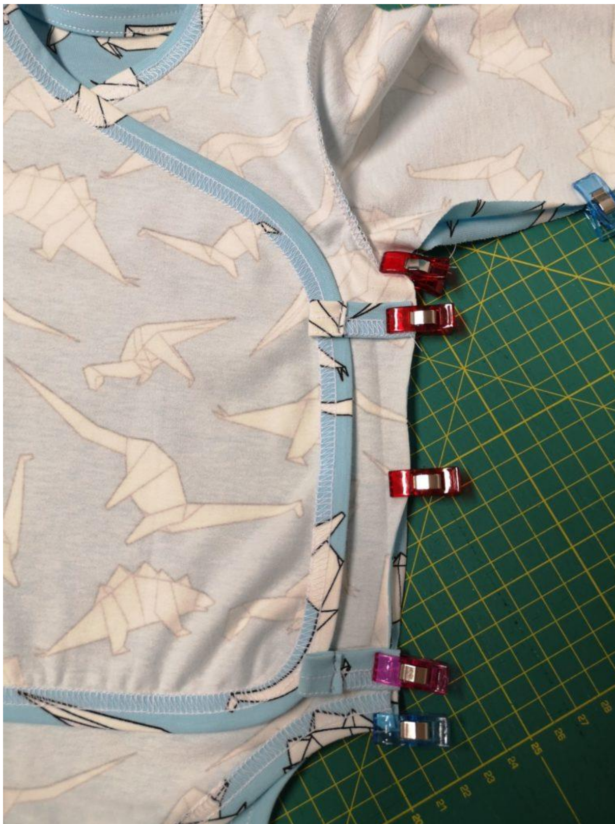
13. Detail našpendlení.