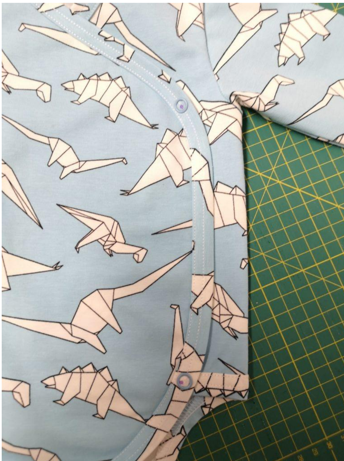
23. Patentky přiděláme na pravý PD