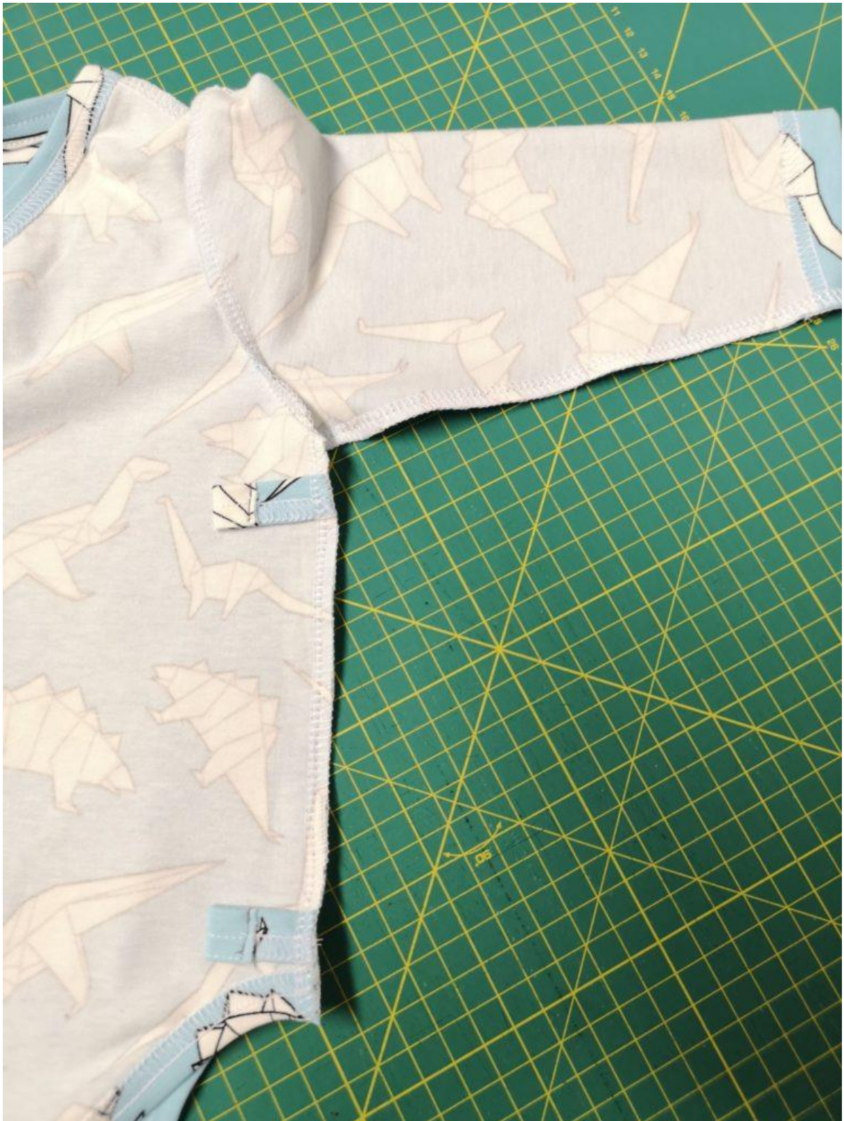
14. Šev sešijeme