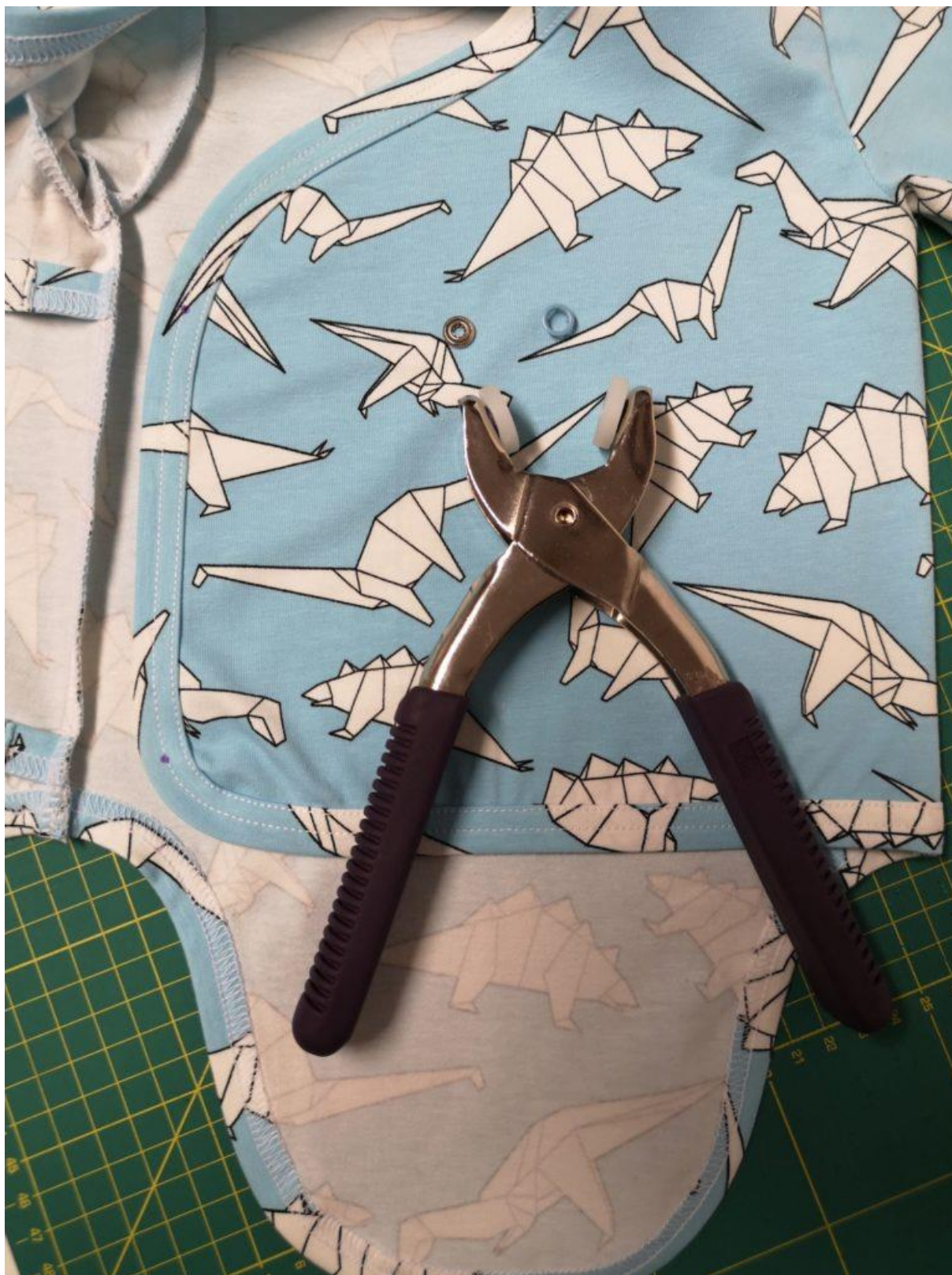
22. Na přidělování patentek doporučuji kleště Vario od značky Prym